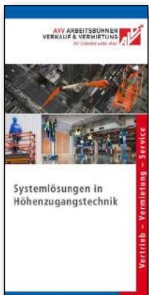
Arbeitsbühnen jeder Art