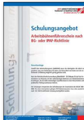
Schulungen & Arbeitsbühnenführerschein